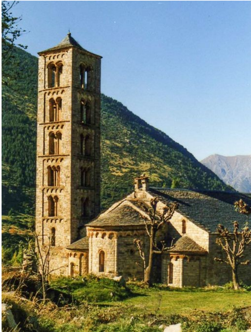
Figura 1: San Clemente de Tahull

El arte románico surge como consecuencia de la prosperidad material acaecida con la expansión agrícola, las roturaciones y el aumento demográfico. Además, la expansión territorial militar abrió nuevas rutas comerciales e hizo posible nuevos caminos de peregrinación que se jalonaron con iglesias románicas como, por ejemplo, el Camino de Santiago en la península ibérica. La riqueza originada, la expansión territorial y el afán de renovación espiritual inspiró la construcción de gran número de iglesias y de edificios religiosos.