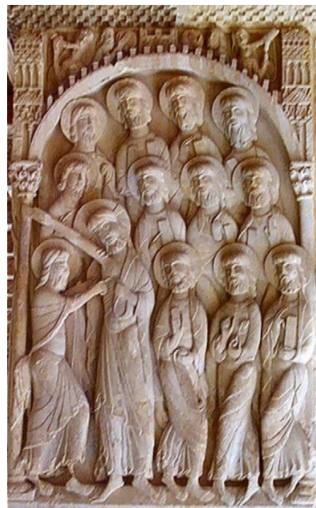
Figura 2: La duda de Santo Tomás, Silos