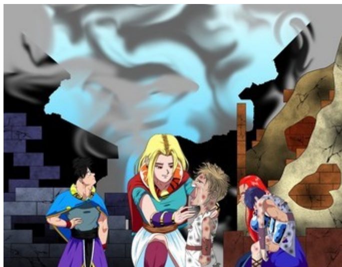
Luis Miranda Guerra. Ciudad destruída. (CC BY-SA)

Y sin más preámbulos, la esfinge alza su mano y os veis rodeados de una especie de niebla rosada. Cuando desaparece, ante vuestros ojos, tenéis las ruinas de una ciudad. Varias personas se os acercan. A pesar del dolor que se transmite en sus ojos por haberlo perdido casi todo, dibujan una tímida sonrisa de esperanza en sus rostros al veros llegar.