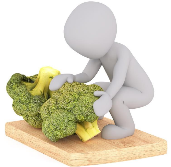
Imagen de Adquisitivo, Comida y Brócoli, de Peggy_Marco. Licencia Pixabay . Fuente: https://pixabay.com/es/illustrations/adquisitivo-comida-br%20c3%20coli-verduras-2064953/