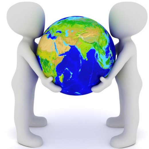
Imagen de Tierra, Globo y Protección, de Peggy_Marco. Licencia Pixabay . Fuente: https://pixabay.com/es/illustrations/tierra-globo-proteccion-planeta-1020214/