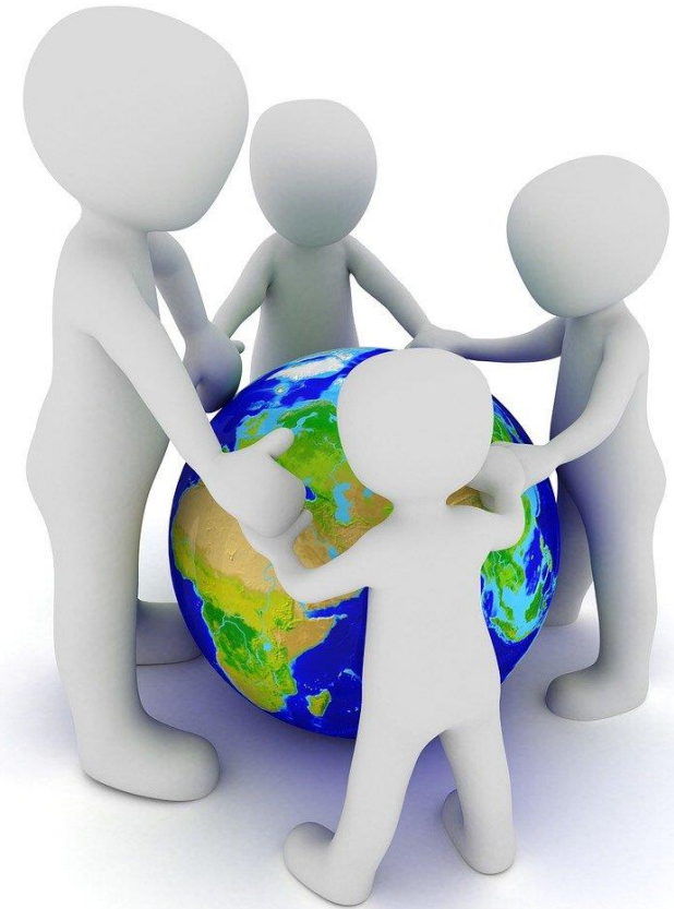
Imagen Tierra, Globo y Protección, de Peggy_Marco. Licencia Pixabay . Fuente: https://pixabay.com/es/illustrations/tierra-globo-proteccion-planeta-1013746/