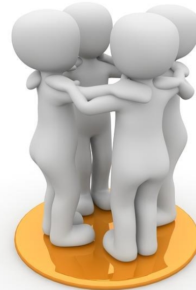
Imagen de Amigos, Camaradas y Compañerismo, de Peggy_Marco. Licencia Pixabay . Fuente: https://pixabay.com/es/illustrations/tierra-globo-proteccion-planeta-1013746/