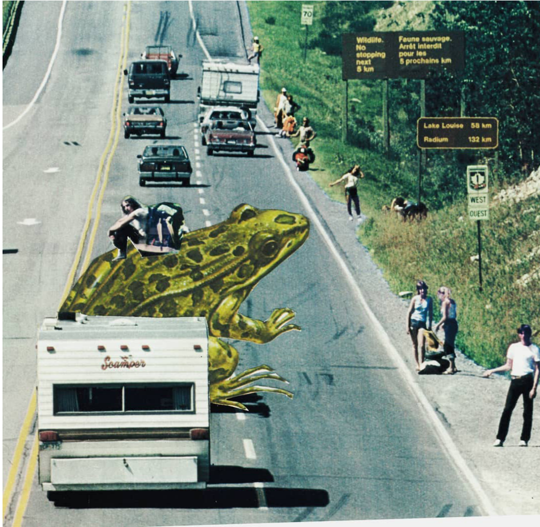
Collage. Miriam Prieto.