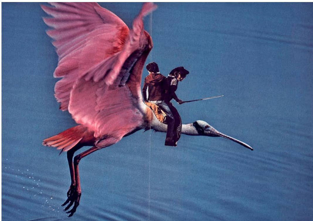
Collage. Miriam Prieto.