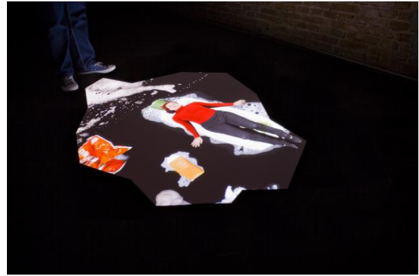
Deriva , Daniel Canogar, 2011.