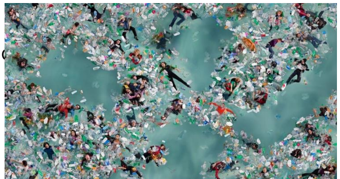
Vórtices , Daniel Canogar, 2011. Fundación Canal YII.