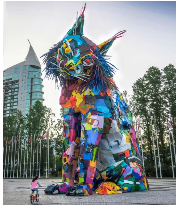
Lince ibérico , Lisboa, Bordalo II, 2019 - photo by Bordalo II