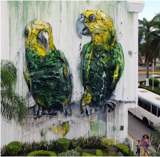
Los Loros , México, Bordalo II, 2016, photo by Bordalo II