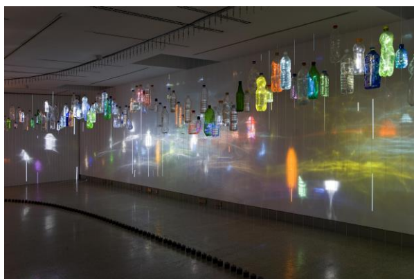
Tajo , Daniel Canogar, 2011.