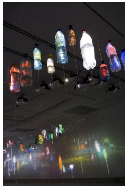
Tajo , Daniel Canogar, 2011.