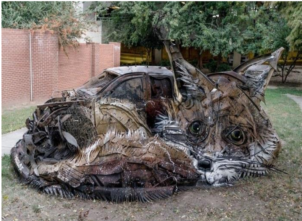
Fox , Arkansas, Bordalo II, 2016