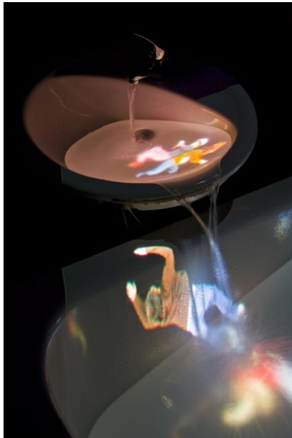
Caudal , Daniel Canogar, 2011.