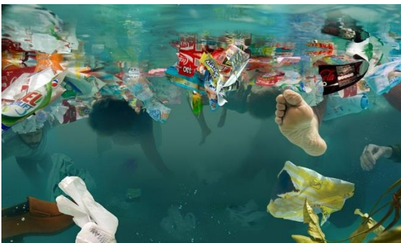
Vórtices , Daniel Canogar, 2011. Fundación Canal YII. ©Studio Daniel Canogar. Fuente: Studio Daniel Canogar.