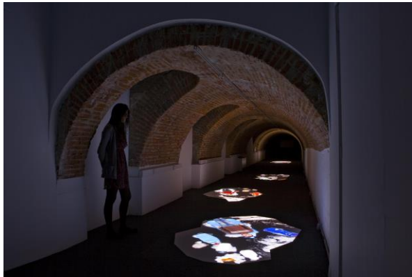
Deriva , Daniel Canogar, 2011.