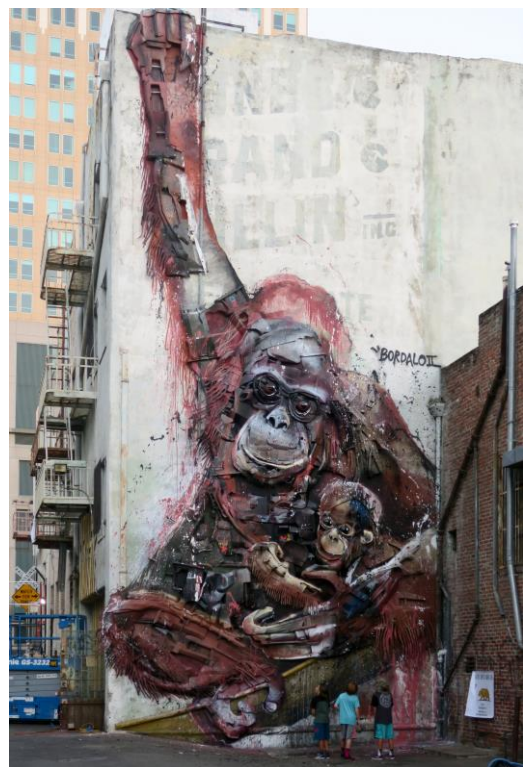
Orangotangos , Wide Open Wallen art festival, Sacramento, Bordalo II, 2018, photo by Bordalo II.