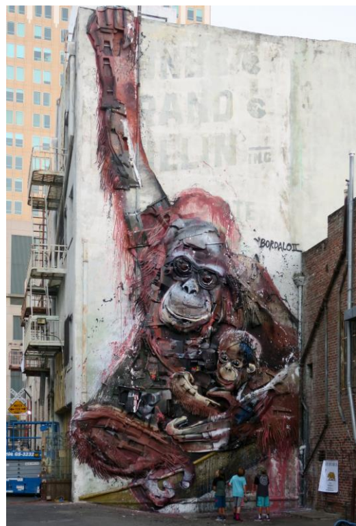
Orangotangos, Wide Open Wallen art festival, Sacramento, Bordalo II, 2018.