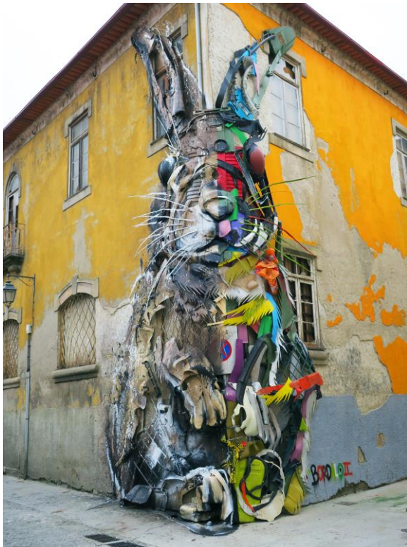
Half Rabbit, "Gaia todo un mundo" serie "Big trash animals", Portugal, Bordalo II, 2017- photo by Bordalo II.