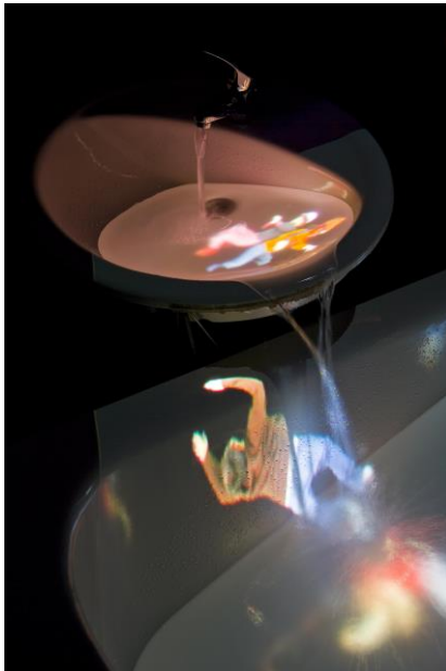
Caudal, Daniel Canogar, 2011. ©Studio Daniel Canogar. Fuente: Studio Daniel Canogar.