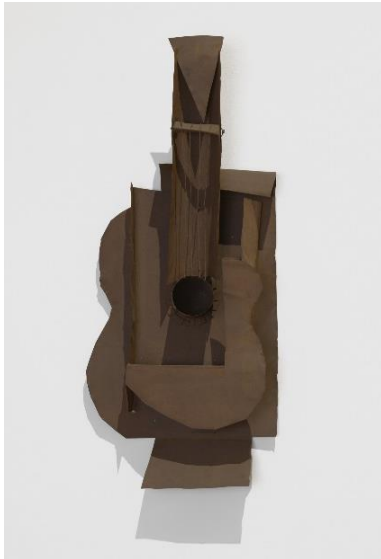
Guitarra , Pablo Picasso, 1914. © Sucesión Pablo Picasso, VEGAP, Madrid, 2023. Fuente: https://www.moma.org/collection/works/80934?classifications=any&date_begin=Pre-

Posteriormente se empezaron a pegar y a manipular los materiales de tal forma que dotaban al collage de tridimensionalidad, pasando a ser esculturas construidas.