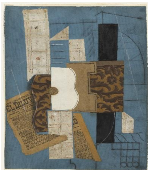
Guitarra , Pablo Picasso, 1913. © Sucesión Pablo Picasso, VEGAP, Madrid, 2023. Fuente: