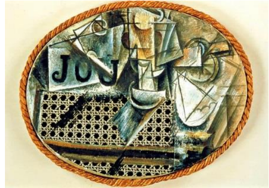
Naturaleza muerta con silla de rejilla . Pablo Picasso, 1912. © Sucesión Pablo Picasso, VEGAP, Madrid, 2023. Fuente:

Los iniciadores de esta técnica en el ámbito artístico fueron Pablo Picasso y Georges Braque, y se considera que sus collages constituyen el primer antecedente conocido del reciclado artístico. El cuadro más destacado como origen del collage es Naturaleza muerta con silla de rejilla , en el que en 1912 Picasso incorporó un hule con estampado de rejilla y una cuerda de cáñamo como marco.