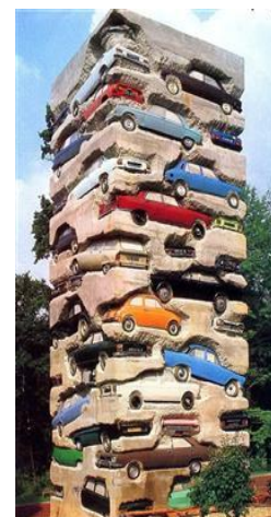
Long term parking , Arman, 1982. © Arman, VEGAP, Madrid, 2023. Fuente: https://www.arman-studio.com/RawFiles/002613.html