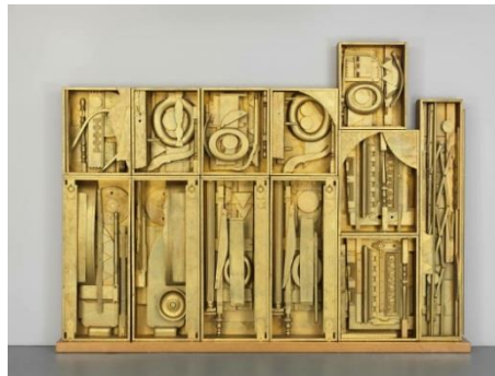
Royal Tide II , Louise Nevelson, 1961-63. © Louise Nevelson, VEGAP, Madrid, 2023. Fuente: https://whitney.org/collection/works/428