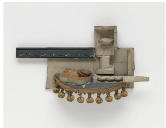
Naturaleza muerta , Pablo Picasso, 1914. © Sucesión Pablo Picasso, VEGAP. Fuente: https://www.tate.org.uk/art/artworks/picasso-still-life-t01136 Construcción en relieve que incorpora objetos encontrados (fleco de tapicería).

El artista dadaísta Marcel Duchamp realiza ensamblajes al unir distintos objetos en sus obras tridimensionales. Empieza a trabajar con la descontextualización del objeto cotidiano que «encuentra» en el entorno y al que da un significado distinto. Denomina a este tipo de obra « objeto encontrado » ( objet trouvé / ready made ). Obras como Rueda de bicicleta (1913) o Fuente (1917), suponen un precedente en la reutilización de objetos para darles una nueva función y generar la obra artística.