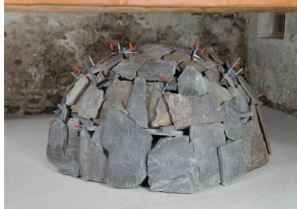
Igloo , Mario Merz, 1990. © Mario Merz, VEGAP, Madrid, 2023. Fuente: https://www.gladstonegallery.com/artist/mario-merz/work-detail/568/em-igloo-ticino-em