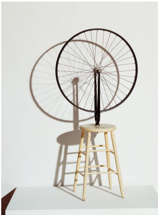
Rueda de bicicleta, Marcel Duchamp, 1913. © Association Marcel Duchamp, VEGAP, Madrid, 2023. Fuente: https://www.centrepompidou.fr/es/ressources/oeuvre/gCIMyPS