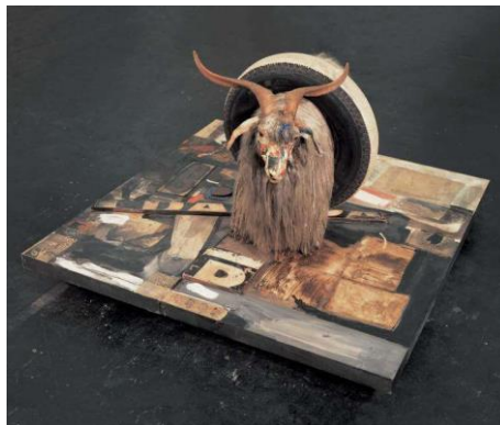
Monogram , Robert Rauschenberg, 1955-59, © Estate of Robert Rauschenberg, VEGAP, Madrid, 2023. Fuente: https://www.rauschenbergfoundation.org/art/art-context/monogram