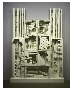
Dawn's Wedding Chapel II, Louise Nevelson, 1959.