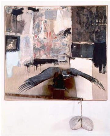
Canyon , Robert Rauschenberg, 1959, © Estate of Robert Rauschenberg, VEGAP, Madrid, 2023. Fuente: https://www.rauschenbergfoundation.org/art/artwork/canyon