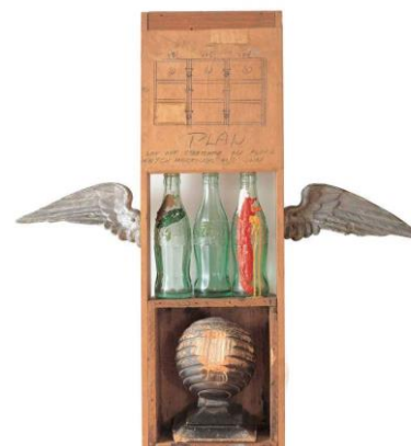
Coca-Cola plan , Robert Rauschenberg, 1958, © Estate of Robert Rauschenberg, VEGAP, Madrid, 2023. Fuente: https://www.rauschenbergfoundation.org/art/artwork/coca-cola-