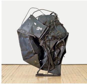
Shortstop , John Chamberlain, 1958. © John Chamberlain, VEGAP, Madrid, 2023. Fuente: http://web.guggenheim.org/exhibitions/chamberlain/images/1958_x_2011.70_chamberlain_a.jpg