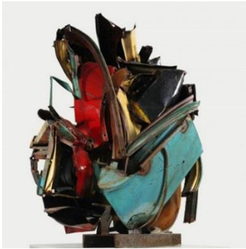
Nutcracker, John Chamberlain, 1958.