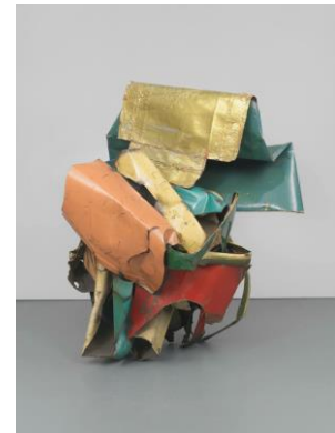
Jackpot , John Chamberlain, 1962. © John Chamberlain, VEGAP, Madrid, 2023.