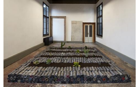
Santa Fe , Jannis Kounellis, 2005-07. © Jannis Kounellis, VEGAP, Madrid, 2023.

Michelangelo Pistoletto. http://www.pistoletto.it/eng/home.htm