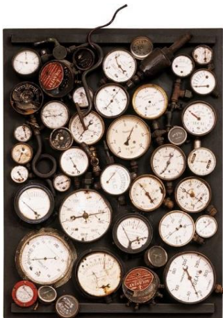
Le colere monte , Arman, 1961. © Arman, VEGAP, Madrid, 2023. Fuente: http://www.arman-studio.com/RawFiles/003919.html