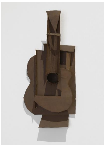
Guitarra , Pablo Picasso, 1914. © Sucesión Pablo Picasso, VEGAP, Madrid, 2023. Fuente: https://www.moma.org/collection/works/80934?classifications=any&date_begin=Pre-

Desde sus inicios, Picasso realiza esculturas con distintos materiales, a las que se refiere como construcciones .