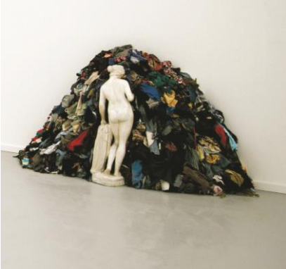
Venere degli stracci , Michelangelo Pistoletto, 1967. © Michelangelo Pistoletto | Courtesy GAM - Galleria Civica d'Arte Moderna e Contemporanea, Torino. Foto di Studio Gonella. Proprietà della Fondazione per l'Arte Moderna e Contemporanea CRT

En los años 60 surge en Italia el Arte Povera , que emplea materiales humildes o pobres.