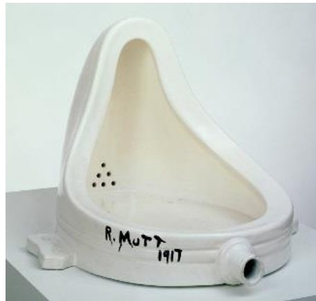
Fuente, Marcel Duchamp, 1917.

A lo largo de su carrera, Picasso reutiliza y ensambla objetos desechados en parte de sus esculturas, ya sea como «objetos encontrados» o como objetos integrados en la escultura con otros materiales, como veremos en el anexo 8.