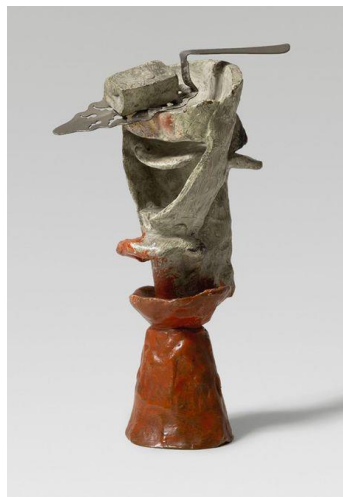
Copa de absenta , Pablo Picasso, 1914. © Sucesión Pablo Picasso, VEGAP. Fuente: https://www.museopicassomala.org/coleccion/copa-de-absenta