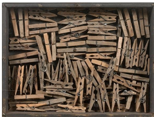
En famille , Arman, 1962. © Arman, VEGAP, Madrid, 2023. Fuente: http://www.arman-studio.com/RawFiles/134009.jpg