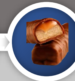
Chocolate y barritas