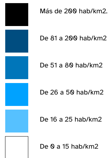
Mapa de España-provincias.

2) De acuerdo con la leyenda, pinta del color indicado las diferentes provincias en términos de densidad de población.