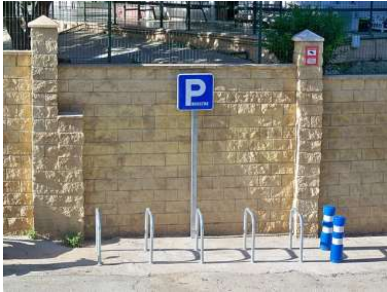
«Bicycle Parking in Málaga» por Daniel Capilla. CC BY-SA 4.0

Observa el siguiente modelo de aparcamiento para bicicletas: